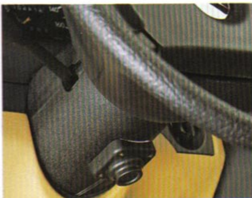
Betätigungsknopf für die Alarmanlage (Wahlausstattung). Vorrüstung oder Komplettanlage.