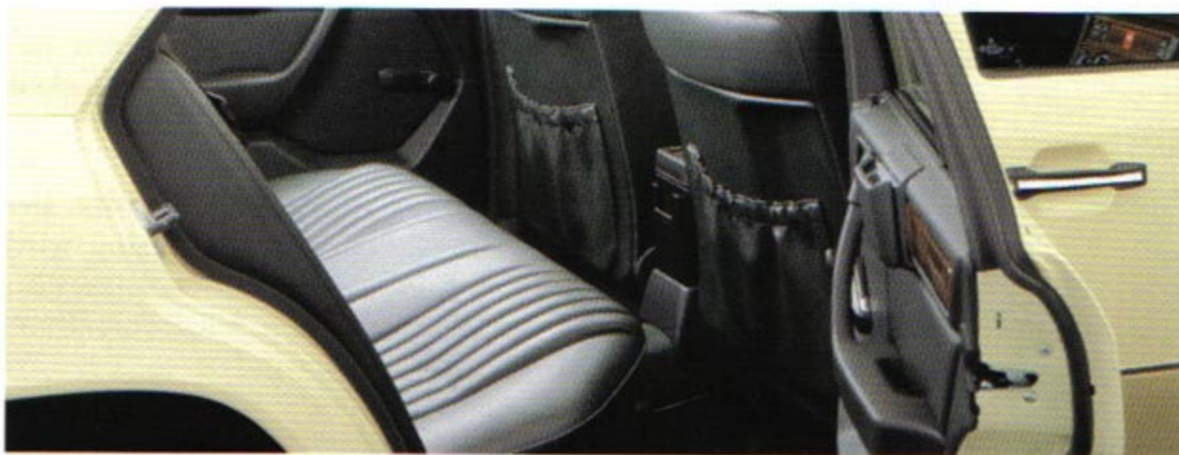
Geräumiger Fond-Innenraum, bequemer Einstieg durch weit öffnende Türen.

keinerlei Probleme. Der Kofferraum der 190er Modelle (410 Liter) und der Modelle 200 D-300 E 4MATIC (520 Liter) bietet genügend Platz dafür. Ganz zu schweigen von den großzügigen Laderaum-Verhältnissen in der T-Reihe. Auch das fällt positiv auf: Man sieht einem Mercedes-Taxi kaum an, wie viele Kilometer es schon »auf dem Buckel hat«. Durch die schon sprichwörtliche Mercedes-Benz Verarbeitungsqualität und die Verwendung zweckentsprechender, hochwertiger Materialien halten sich die Abnutzungserscheinungen auch bei harter Praxis in Grenzen. Das gilt ganz besonders für den Innenraum, der am stärksten beansprucht wird. Hier schaffen ein stabiler, auf Langstreckenkomfort ausgelegter Polsteraufbau sowie Arm-