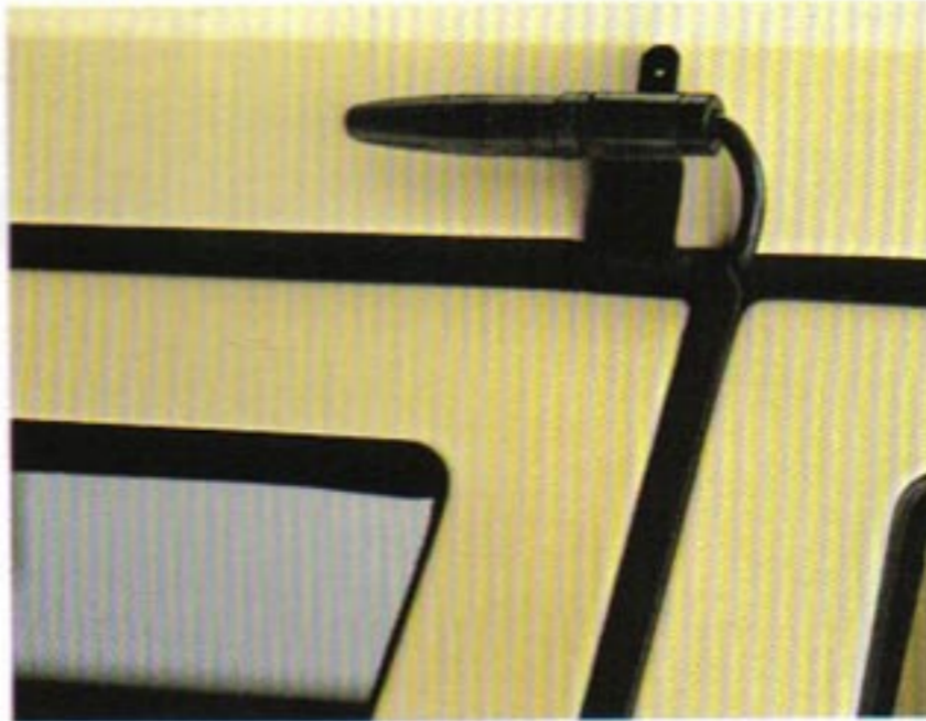
Steckkontakt für die Dachzeichenbeleuchtung.