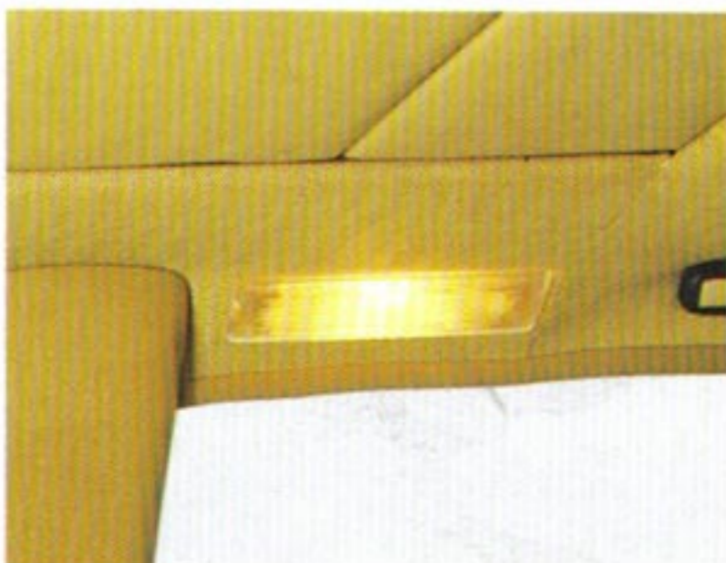
Dreifache, in der Helligkeit verstärkte Fond-Innenraum-Beleuchtung für die Modelle 200 D-300 TE 4MATIC.