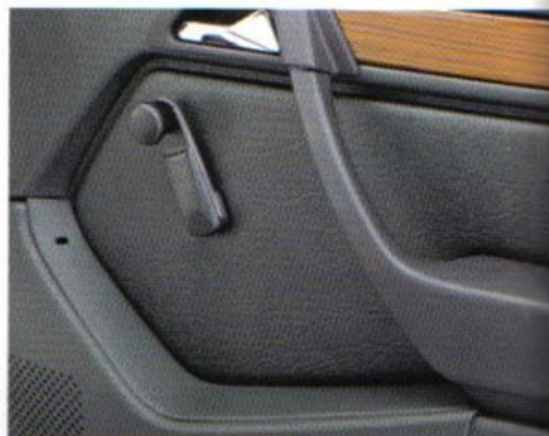
Tasche an Beifahrertür mit austauschbarem Verschlußdeckel - für die Modelle 200 D-300 TE 4MATIC.