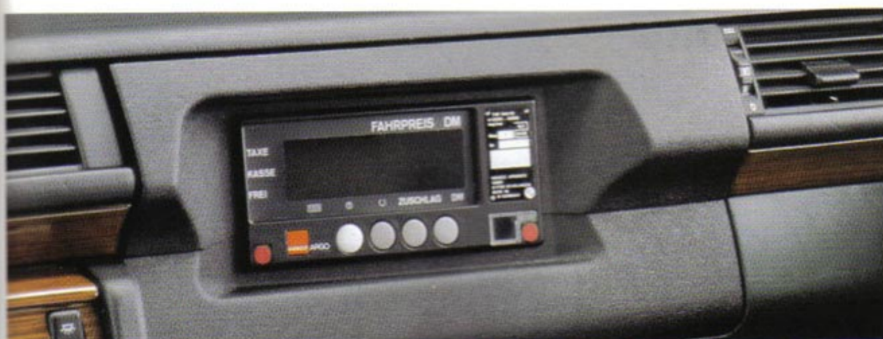
Umfang I: Handschuhkasten vorbereitet zum Einbau elektronischer Taxameter (200 D-300 TE 4MATIC) anstelle