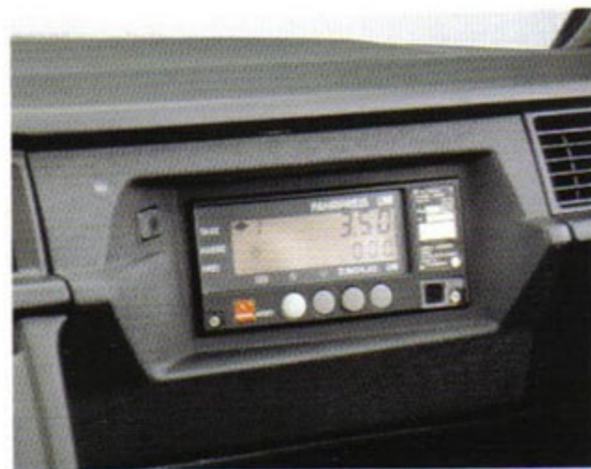
Handschuhkasten vorbereitet zum Einbau elektronischer Taxameter (190 D - 190 E 2.3).