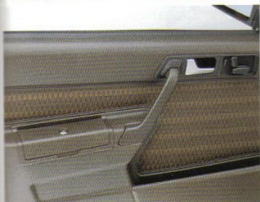
Verschließbarer Behälter in Fahrertür (190 D - 190 E 2.3).