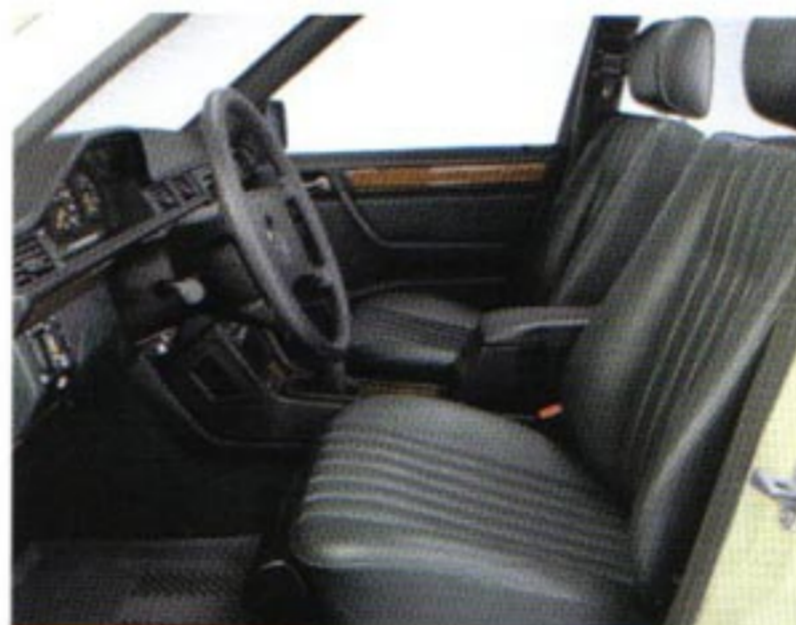
Verstärkte Sitze vorn und hinten - entlastender Komfort für den harten Taxi-Alltag und die Fahrgäste.