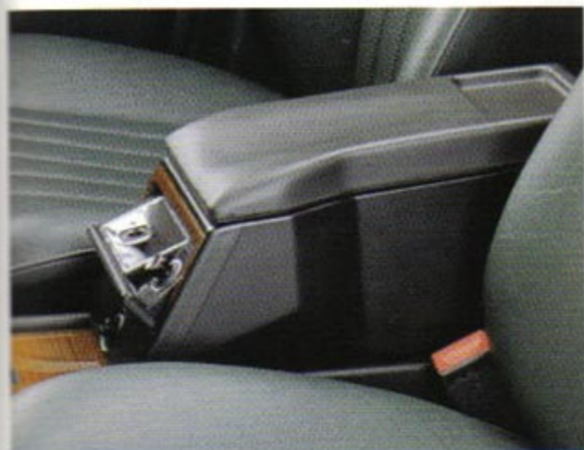
Fahrer-Aschenbecher in Ablageschale.