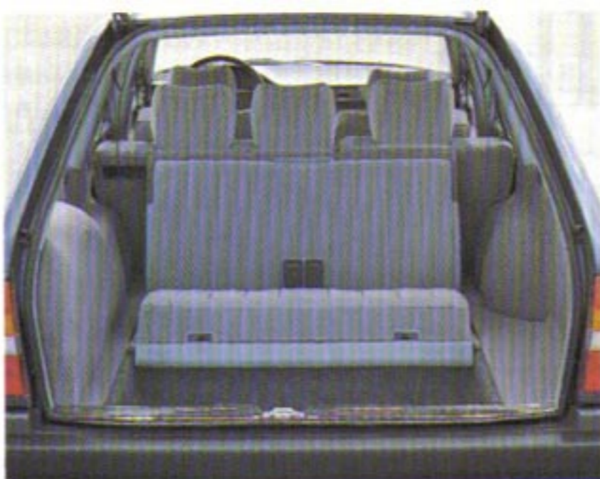
Mit der dritten Sitzreihe (Sonderausstattung T-Reihe) können Sie bis zu sechs Fahrgäste befördern.

Mit anderen Worten: eine Taxe mit dem Stern steht unter allen Einsatzbedingungen immer gut da. Das und die hohe Sicherheit eines Mercedes-Benz sind sicherlich die entscheidenden Gründe für viele Fahrgäste, vorzugsweise ein Mercedes-Taxi zu wählen.