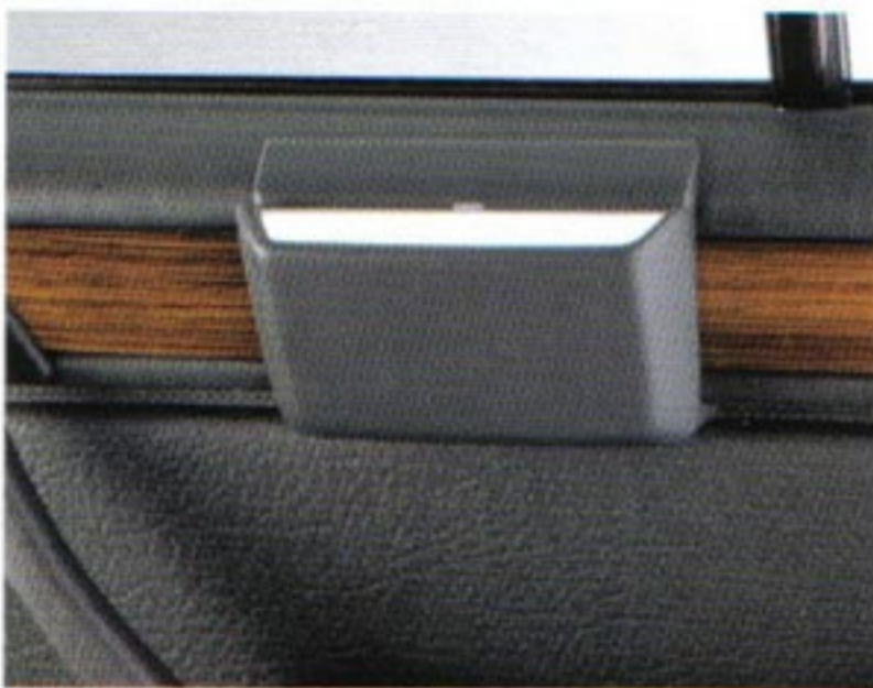
Aschenbecher in den Fondtüren, gegen Herausreißen gesichert.