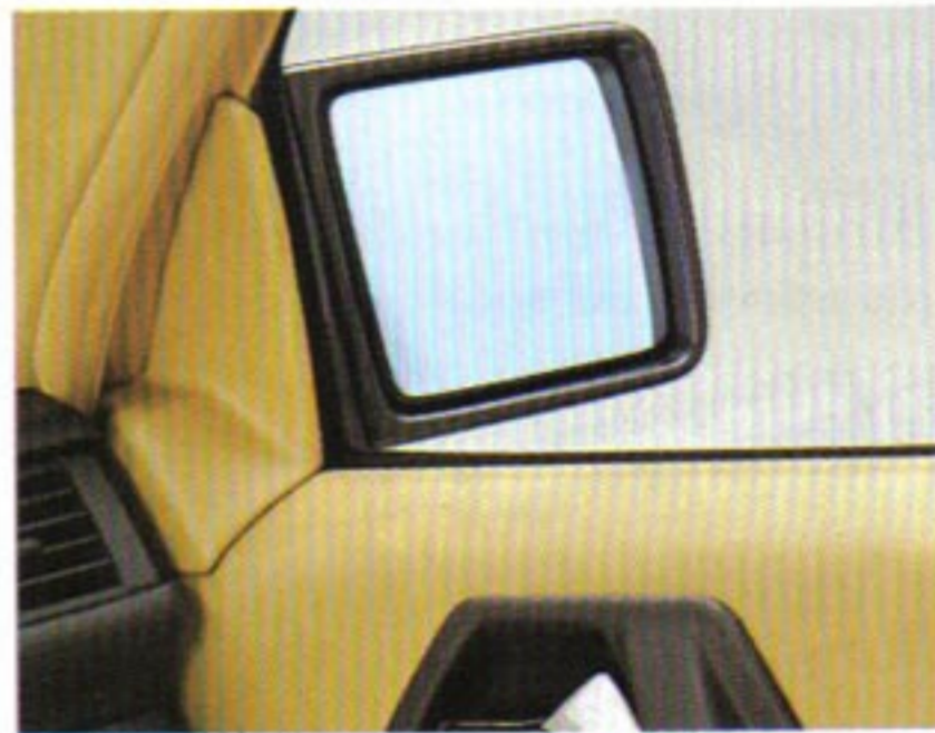
Rechter Außenspiegel beheizt, von innen elektrisch einstellbar.