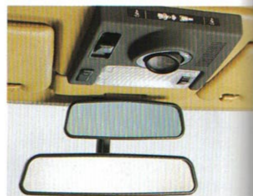
Halogen-Schwenk-Arbeitsleuchte. Tandem-Innenspiegel als Sonderausstattung.