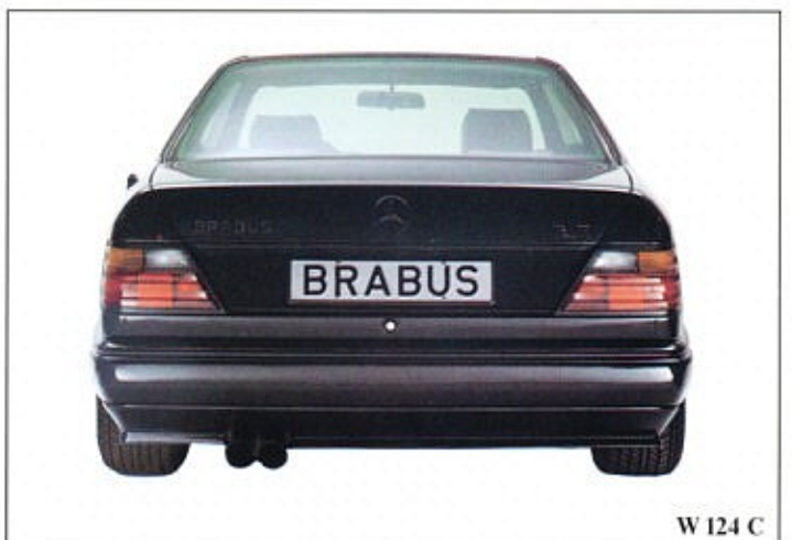
W 124 C