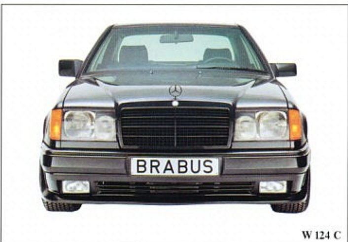
W 124 C