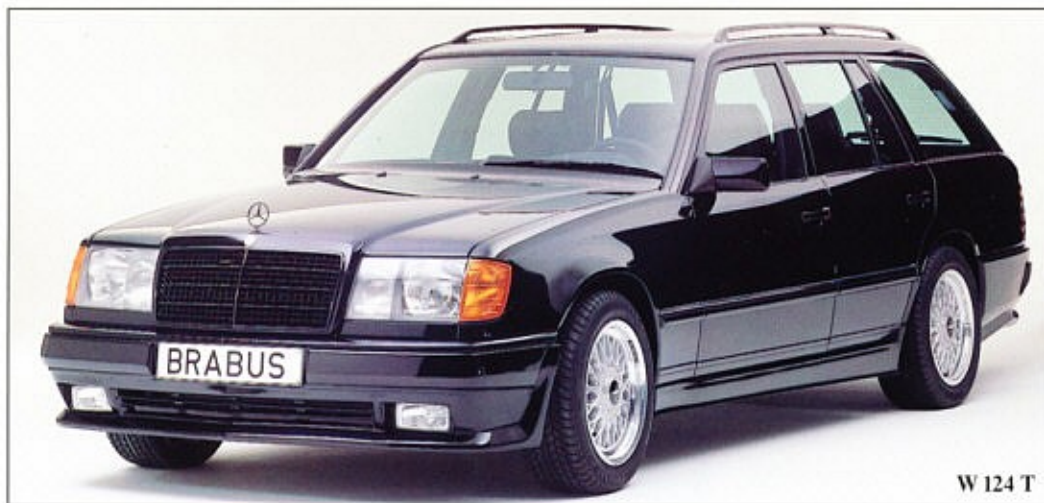
W 124 T