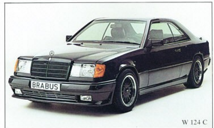
W 124 C