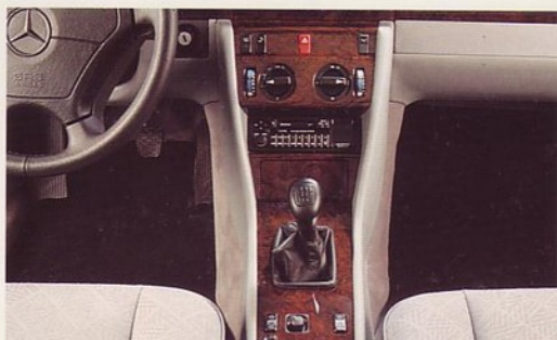
Stuurwiel en versnellingshandle in leer