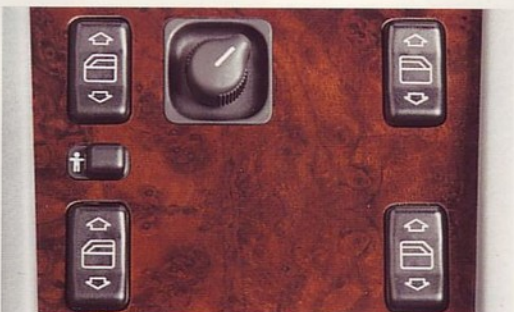
Elektrische zijruitopeners vóór én achter