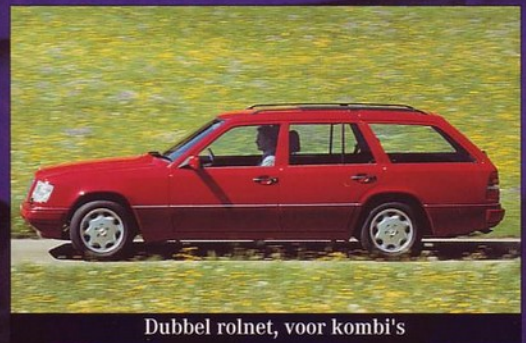
Dubbel rolnet, voor kombi's