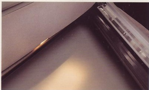
Uitstaplichten in de portieren