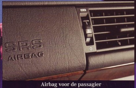
Airbag voor de passagier