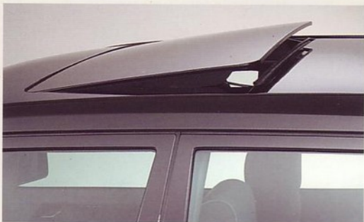
Schuif/kanteldak (elektrisch bediend)