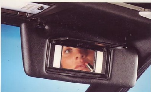
Zonnekleppen met spiegelverlichting