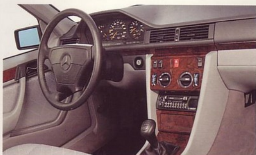
Dashboard in wortelnotenhout