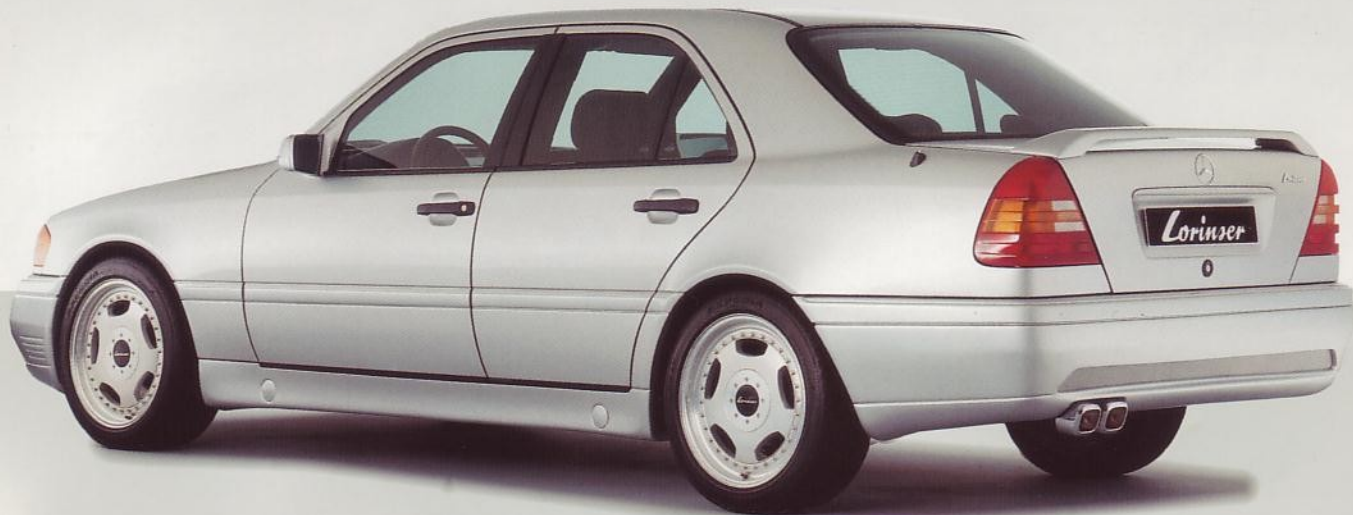
Heckschürze Sportline, Auspuff-Endrohre, Seitenschweller, Heckflügel, RSK 2-Felgen 8 x 17 Zoll. Rear apron Sportline, exhaust end pipes, side-sill-skirts, rear wing, RSK 2-wheels 8 x 17".