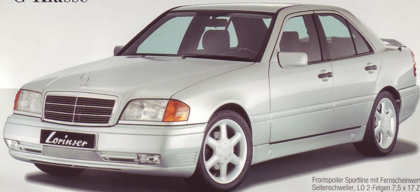
Frontspoiler Sportline mit Fernscheinwerfern, Seitenschweller, LO 2-Felgen 7,5 x 17 Zoll. Frontspoiler Sportline with high-beam-headlamps, side-sill-skirts, LO 2-wheels 7,5 x 17".